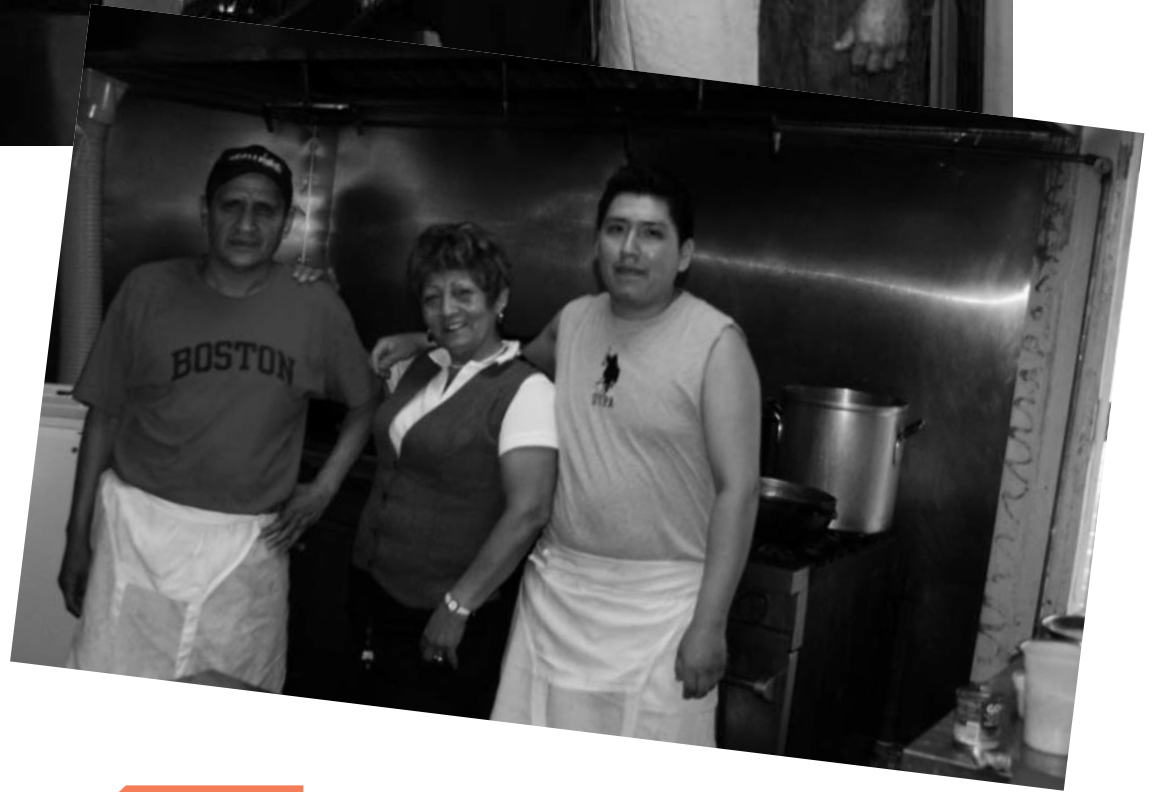
La Tia Pilar, un cevichito, de lo mejor en la Brodway de Passaic.