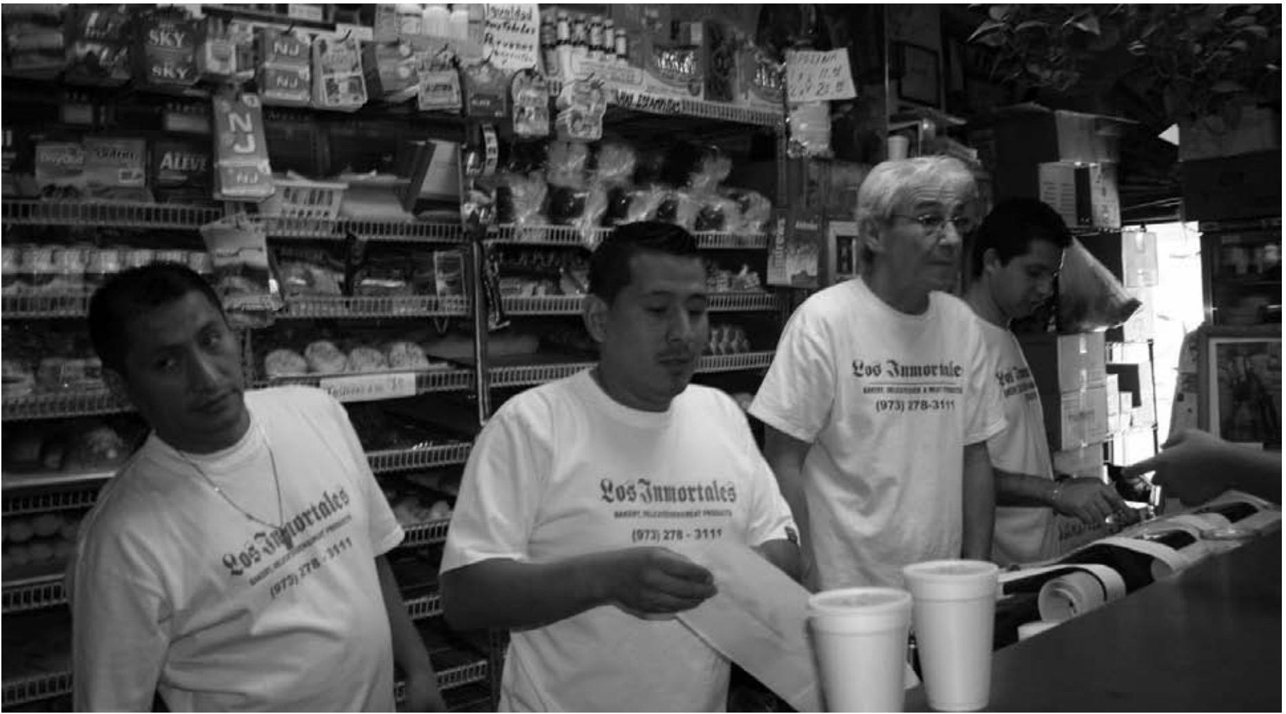
Los inmortales, en la lucha del día a día.