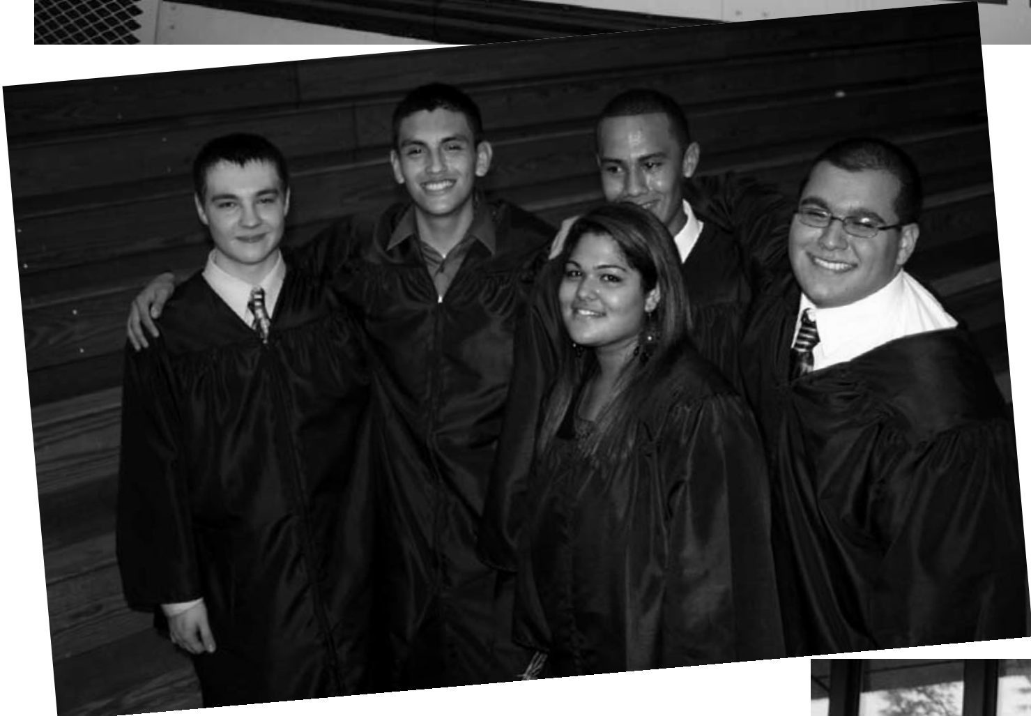
Graduación en High School de Garfield, los triunfos de nuestros hijos son nuestros triunfos.