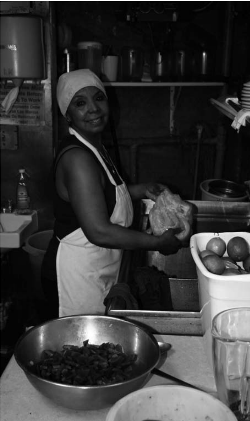
Las cocinas de Chichi 1. La especialidad caucau de mariscos.